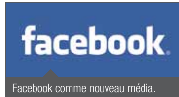
Facebook comme nouveau média.

Un projet d'une telle envergure nécessite une communication dépassant le cadre conventionnel. Mobimo s'est donc fixé comme objectif d'utiliser les nouveaux médias – et particulièrement les réseaux sociaux – pour faire connaître son projet.