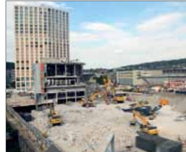
Le début des travaux de construction.

La construction de 143 appartements «am Pfingstweidpark» a commencé à l'ouest de Zurich en 2011. Avec son architecture exceptionnelle et la diversité des logements conçus, l'ensemble est parfaitement adapté au lifestyle urbain. Les appartements seront disponibles à partir de 2013.