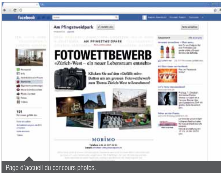
Page d'accueil du concours photos.

Une promotion attrayante a permis de gagner des «fans» pour le projet et la page de fans. Des Ads Facebook ont invité les utilisateurs à poster des photos du quartier «Zürich West». Les photographes ont eu la possibilité d'inviter leurs amis à voter, et la photo ayant obtenu le plus de voix a gagné le premier prix.