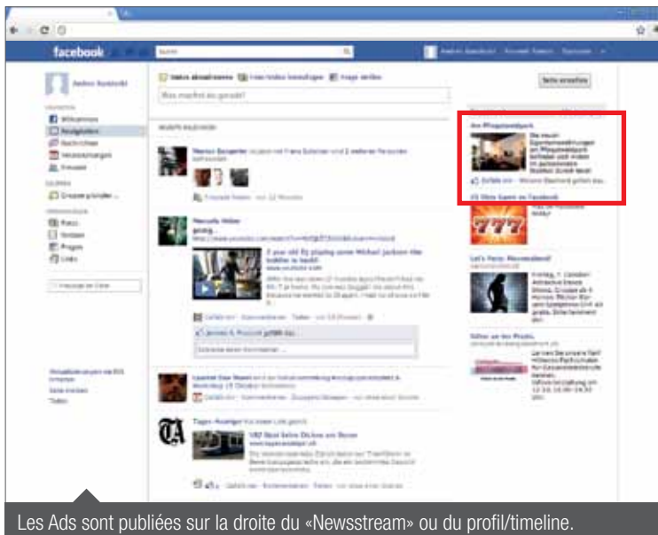
Les Ads sont publiées sur la droite du «Newsstream» ou du profil/timeline.

Pour attirer l'attention du groupe-cible sur le projet «am Pflingstweidpark» et sa page de fans, diverses Ads Facebook ont été mises en ligne, basées sur les paramètres de ciblage appropriés.