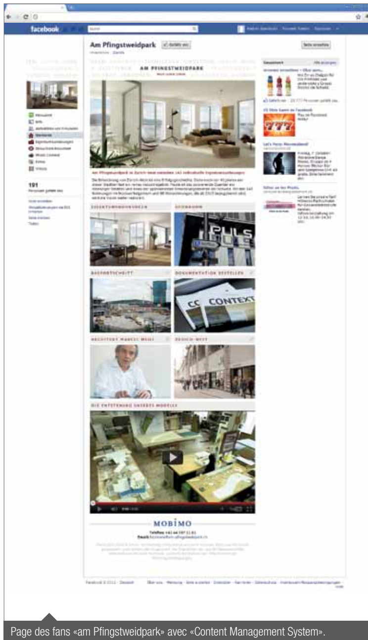
Page des fans «am Pflingstweidpark» avec «Content Management System».

Le projet «am Pflingstweidpark» est premièrement destiné aux habitants de Zurich et agglomération. Du fait de ses nombreuses possibilités de ciblage et de sa large portée, Facebook a été choisi comme canal principal.